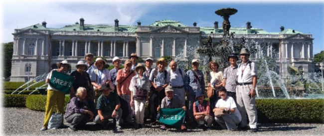
本館 南側(主庭)にて

◇コース 大船駅＝(JR)＝四ツ谷駅 ～ 四谷見附交差点付近(昼食)～迎賓館(12:30～本館・和風別館・庭園を参観)～ 四ツ谷駅(解散 15:30)