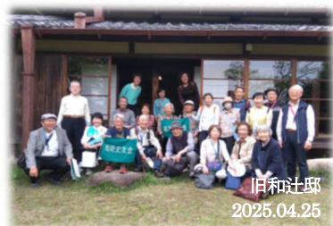
旧川喜多邸別邸(旧和辻邸)

・コース 鎌倉生涯学習センター前～鐺木清方記念美術館～川喜多映画記念館・旧川喜多邸別邸(旧和辻邸)～鎌倉国宝館～カトリック雪ノ下教会(解散)。