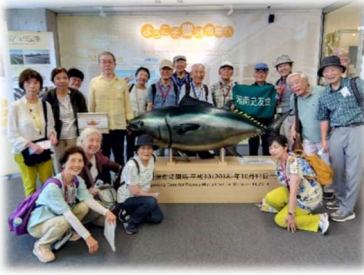
豊洲市場 まぐろを囲んで