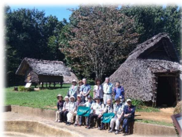
大塚・歳勝土遺跡にて

◇コース センター北駅(市営地下鉄ブルーライン)～横浜市歴史博物館～大塚・歳勝土遺跡～センター南駅(昼食)～正覚寺～茅ヶ崎城址公園～センター南駅(解散 14:30)