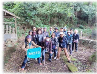
金剛寺大師堂(盛長の墓前)

特記 飯山観音入口では様々な色の花が咲き始めた“ざる菊の畑”が迎えてくれた。金剛寺和尚の読経と説明をいただき、この地を領地とした安達盛長の位牌や墓を拝観した。その後、約250段を上って開山1,300年を迎えた飯山観音にたどり着いた。一日中秋雨が続き、少し早めの解散となった。