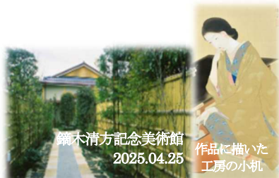
鐺木清方記念美術館