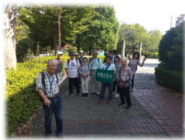
正覚寺前 なのはな公園

特記 9月末、気温30℃という暑い一日でした。休館の横浜市歴史博物館にレクチャーをお願いした後、弥生時代の大塚・歳勝土遺跡を歩いて、当時のムラの生活を思い浮かべた。午後は、都築のあじさい寺正覚寺と茅ヶ崎城址を散策した。