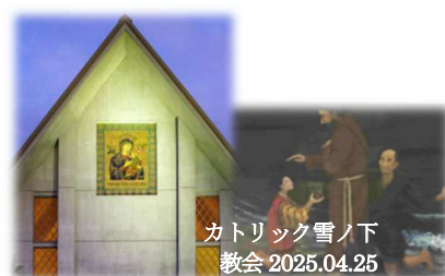
カトリック雪ノ下教会

特記 ツツジが咲き始めた若宮大路に穏やかな季節の訪れを感じながら、鐺木清方記念美術館・川喜多映画記念館では身を乗り出して解説に耳を傾け、鎌倉国宝館では目を見張る美しい浮世絵に感動、カトリック雪ノ下教会では殉教の歴史を身近に感じた、芸術と歴史が詰まった印象的な散策でした。