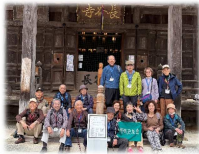
飯山観音 長谷寺にて