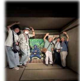
トリックアート迷宮館

特記 施設内を中心の見学で、猛暑の中でも元気に楽しく見学できた。豊洲市場では、まぐろをはじめとする様々な海産物の説明やセリ施設を見学し、早朝のセリの様子を視聴して、清潔に保たれた市場の活気を身近に感じた。午後はトリックアート迷宮館で多くの不思議な体験を楽しんだ。