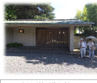
和風別館(游心亭)入口