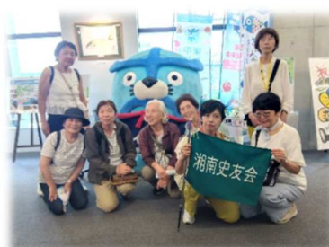
豊洲市場 イッチーノと共に