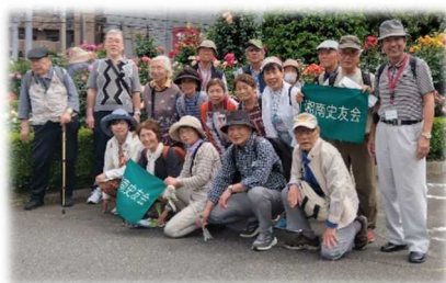
イングリッシュガーデン入口